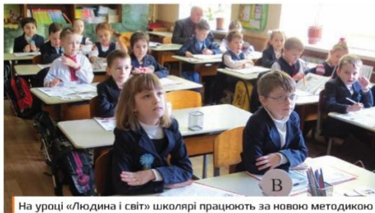
На уроці «Людина і світ» школярі працюють за новою методикою